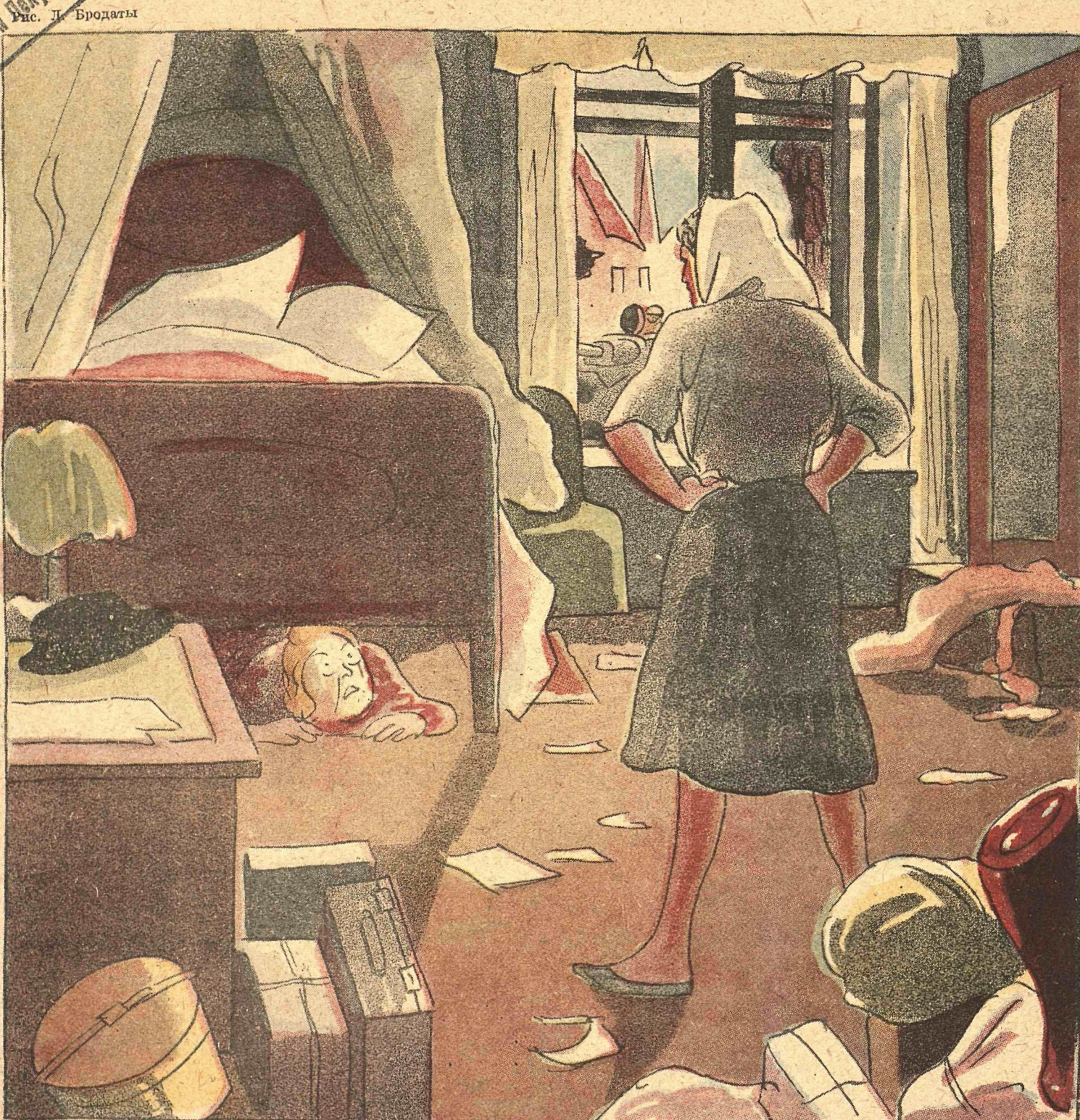
рис. Д. Бродаты

МАТ. ЭНЦИКЛОПЕДИЯ 7. 10. 1945 Мин. На. Народн. Вспомогат. Учр.