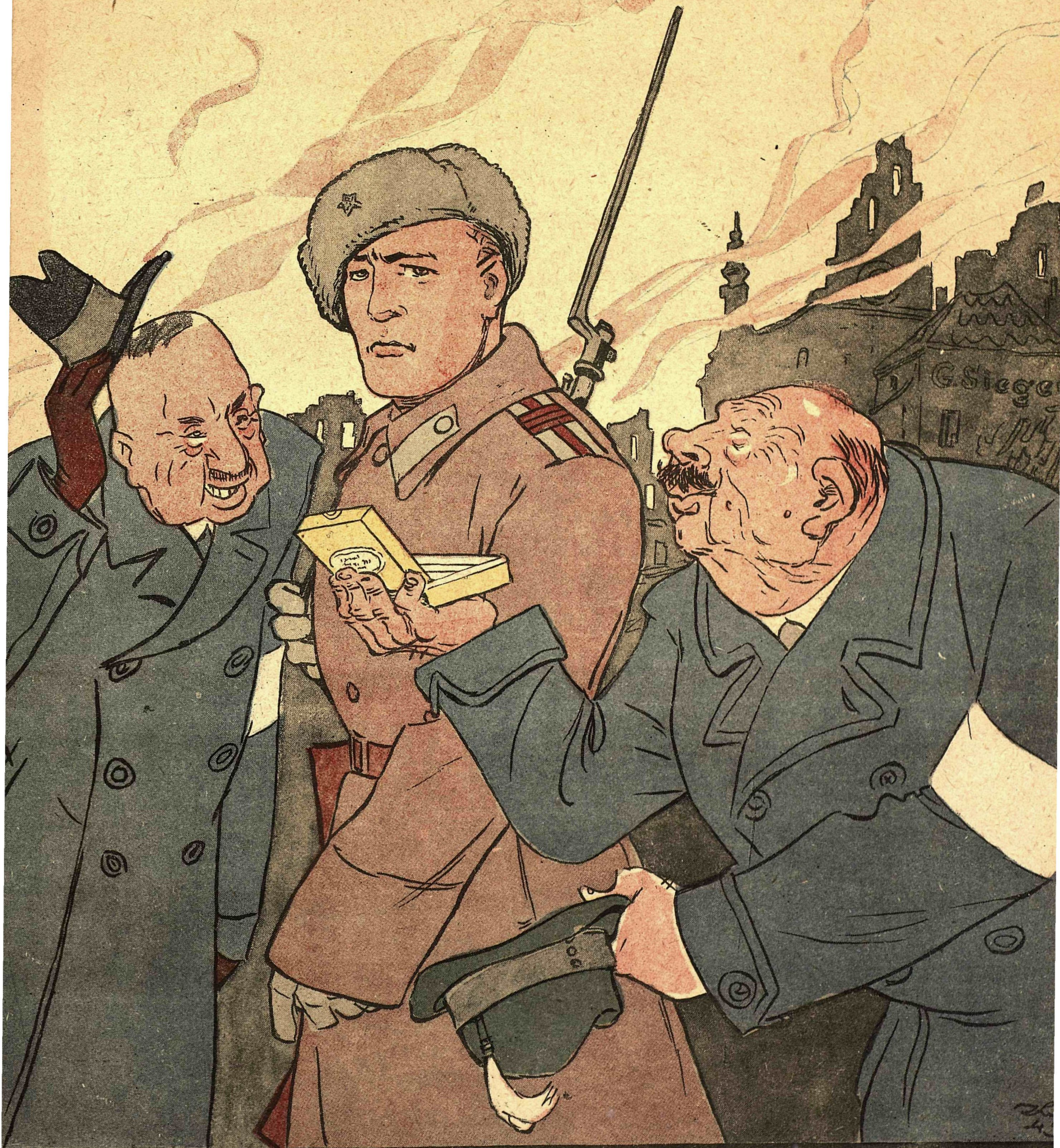
Рис. К. Елисеева