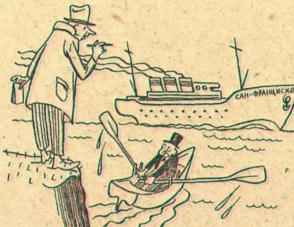
Рис. Г. Валька

— Наконец-то и вы объявили войну Германии! Где собираетесь развернуть операции? — На санфранциском направлении.